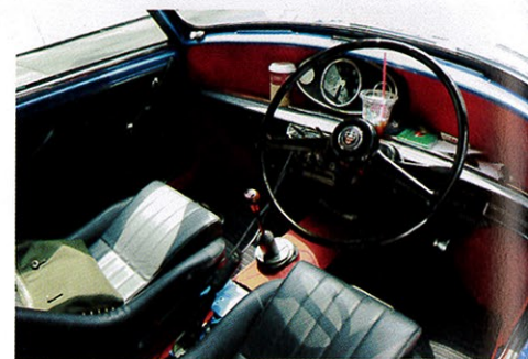
センターメーター、Mkiステアリング、ローバックシートとクラシックな雰囲気満点のインテリア。

グリル:Mkiさざ波グリル/各種Mkiディテール:アウトビンジ、ドア角丸 リアまわり:スモールテールランプ、ライセンスプレート/足まわり:10インチ3.5J鉄チンホイールをブラック塗装 ミラー:ルーカスフェンダーミラー/マフラー:RC40/メーター:オーバル型センターメーター シート:ローバックバケットシート/ステアリング:Mkiステアリング/エアコン:インベリアルクラフトオリジナル etc